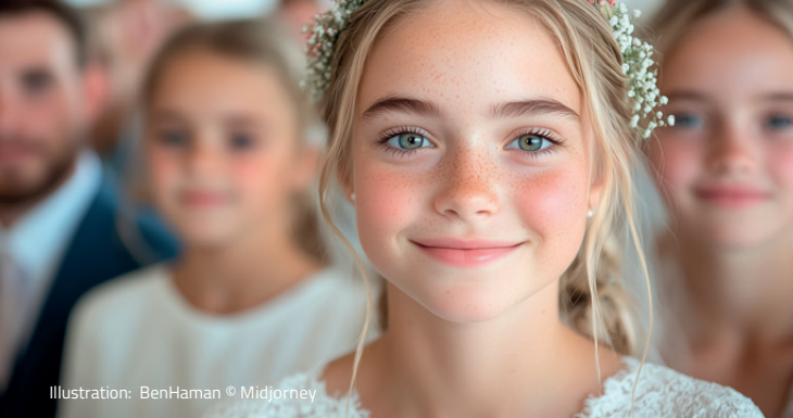
Illustration: BenHaman © Midjorney