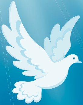
Illustration: Balora