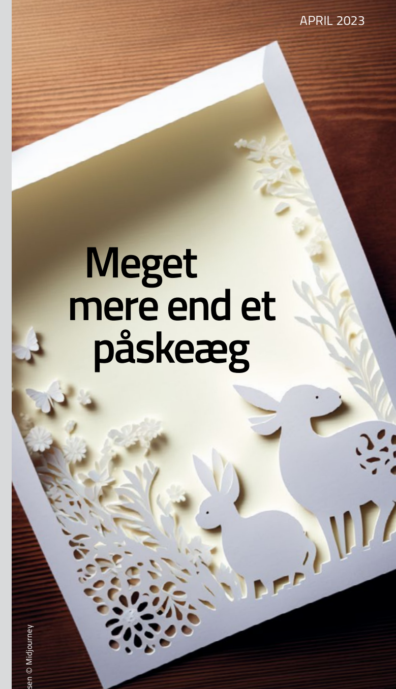
Illustration: Abedamsen © Midjourney

Et gækkebrev kan være udtryk for stor kærlighed. I min skoletid handlede det mest om at score et påskeæg