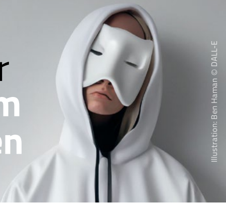
Illustration: Ben Haman © DALL-E

Når jeg tænker tilbage på min barndoms fastelavn, husker jeg, at det var sjovt at finde frem til den helt rigtige udklædning.