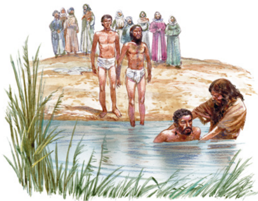
Illustration: Peter Dennis