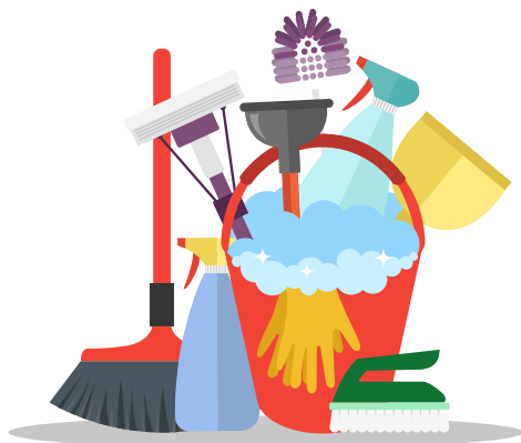
Illustration: makyyz/iStock/Getty Images Plus

Min verden gik ligesom lidt i stykker, og jeg råbte op. Gæsterne var heldigvis ikke