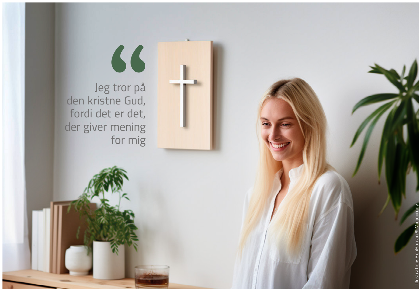
Illustration: BenHaman © Midjourney

Jeg må gerne drikke alkohol, jeg må gerne gå i byen, jeg må gerne være sammen med andre mennesker, der ikke har samme tro og overbevisning som jeg selv.