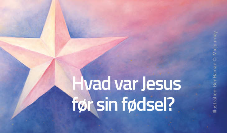
Illustration: BenHaman © Midjourney