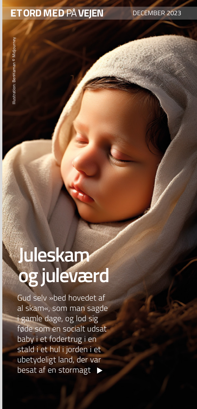
Illustration: BenHaman © Midjourney