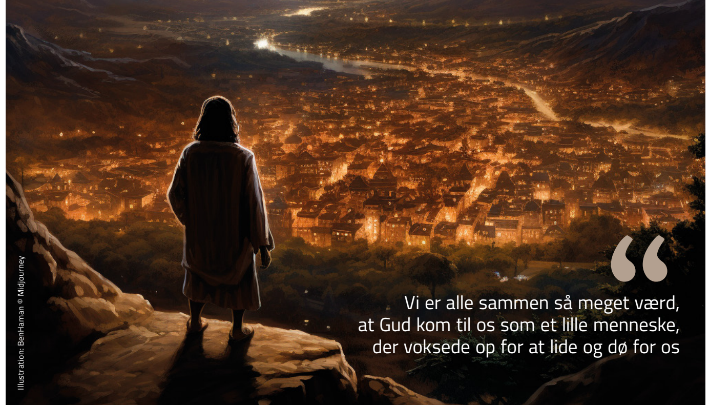
Illustration: BenHaman © MicJourney

Vi mennesker er skabt som sociale væsener. Så vi vil med alle til rådighed stående midler kæmpe for at komme ud af skammen. Vi må – bogstavelig talt –