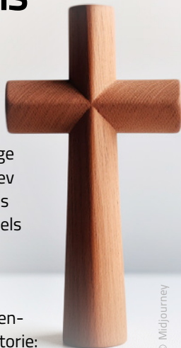
Illustration: BenHaman © Midjourney

Korset blev kristendommens symbol i mindst to omgange.