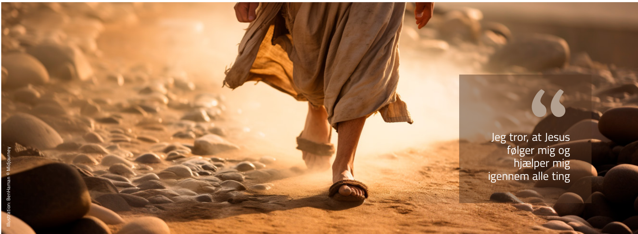
Illustration: BenHaman © Midjourney