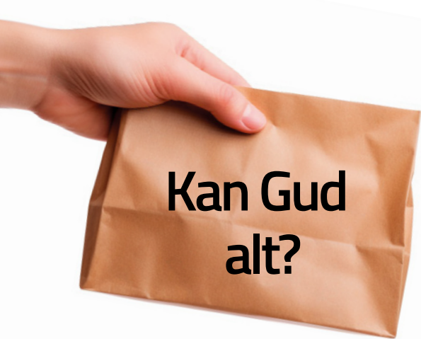
Illustration: BenHaman © Midjourney

To drenge lå i deres senge og talte sammen om stort og småt. Den ene sagde stille: »Jeg ville gerne tro på det med Gud, men jeg kan ikke forstå det!«