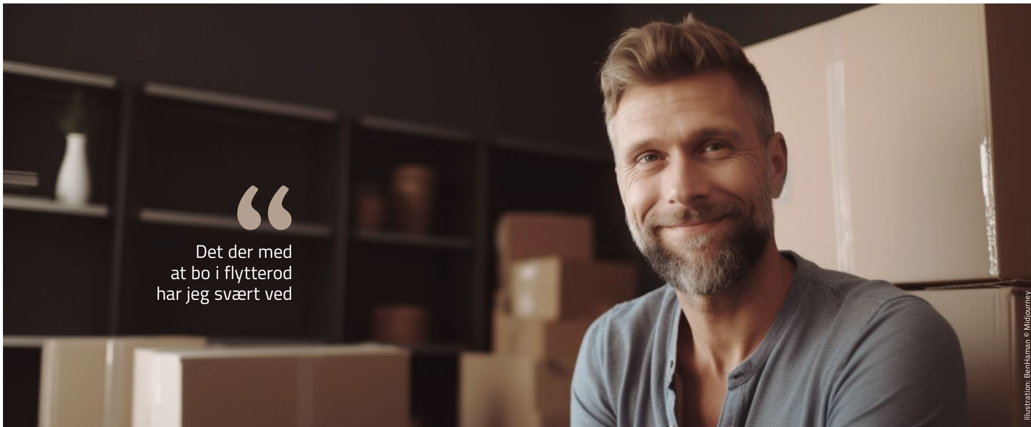
Illustration: BenHaman © MidJourney