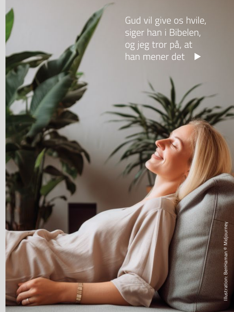
Illustration: BenHaman © Midjourney

Gud vil give os hvile, siger han i Bibelen, og jeg tror på, at han mener det ▶