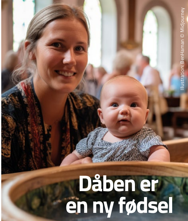
Illustration: BenHaman © Midjourney